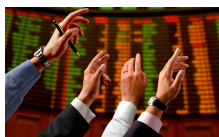
Collocati 7 miliardi di Btp dai 3 ai 30 anni, ma i tassi ormai risalgono