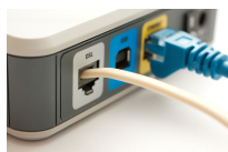
Ecco come scegliere il miglior abbonamento Internet