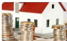
Mutui: continua a crescere l'erogato medio, ma è boom di surroghe