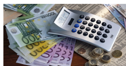
Telecom Italia: dal primo maggio cambiano le tariffe